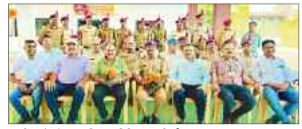
कार्यक्रम के दौरान उपस्थित अतिथि एवं कर्मचारी।