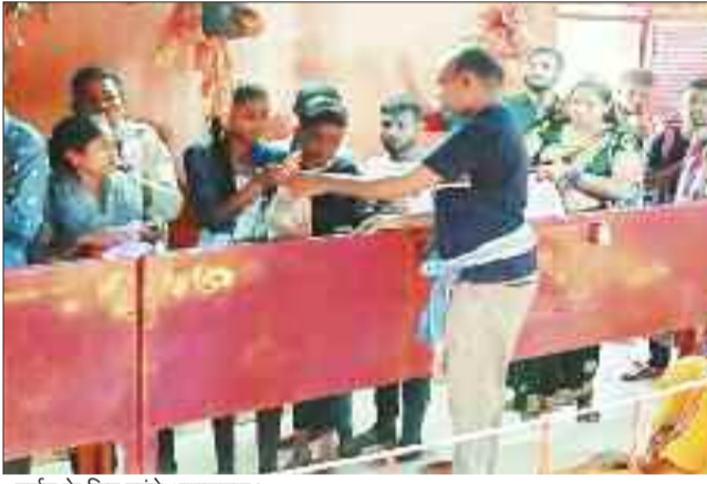
दर्शन के लिए पहुंचे श्रद्धालुगण।

नवरात्रि का पर्व शुरू होते ही मनोकामना ज्योति कलश प्रज्वलित करने के साथ 9 दिन तक चलने वाले भक्ति का पर्व के अवसर पर कई नजारे नजर आ रहे हैं। शहर के मंदिरों में जहां सुबह से भक्तों की कतार लगी रहती है, तो वहीं ग्रामीण अंचलों में कई आदि शक्ति भक्ति में लीन महिलाएं मान्यता पूरी होने के बाद लेटते हुए नाचरिल के सहारे माता के दरबार पहुंच रहे हैं। वहीं मंदिरों में ग्रामीण अंचलों की रामायण मंडलियों के