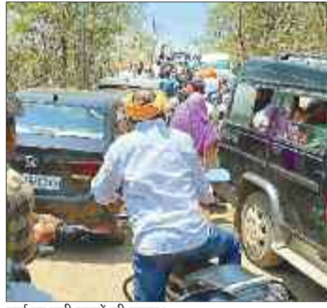
मार्ग पर लगी वाहनों की कतार।

हरिभूमि न्यूज ►► कोरबा 9 दिन तक चलने वाले आदि शक्ति के आराधना का पर्व चैत्र नवरात्रि में मंदिरों में भक्तों की भीड़ नजर आ रही है। नदी किनारे स्थापित माँ सर्वमंगला मंदिर से लेकर पहाड़ पर विराजित मड़वारानी मंदिर तक भक्तों का सैलाब उमड़ा हुआ है। शहरी क्षेत्रों के साथ-साथ ग्रामीण अंचलों से भी बड़ी संख्या में भक्त देवी दर्शन के लिए पहुंच रहे हैं। छत्तीसगढ़ी देवी भक्तों की गीतों से ग्रामीण अंचल के मंदिर गुंजायमान हो रहे हैं।