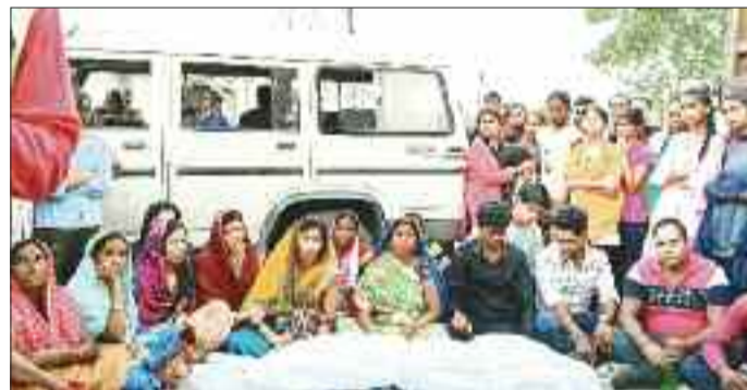
शव रखकर प्रदर्शन करते परिजन व बस्तीवासी।

आखिरकार मौत हो गई है। हादसे के बाद से शाम से ही चक्काजाम बंदस्तूर जारी है और पिछले 24 घंटे से सड़क पर लाश रखकर चक्काजाम जारी है जिससे शहर के अलग-अलग क्षेत्र में भारी वाहनों का काफिला लग गया है। प्रशासन और पुलिस की टीम मामले को सुलझाने में लगी रही रात लगभग 8 बजे मामले का पताक्षेप हुआ तब जाकर यातायात व्यवस्था बहाल हुई। उल्लेखनीय है कि बालको थाना क्षेत्र अंतर्गत परसाभाठा बालको मुख्य मार्ग में