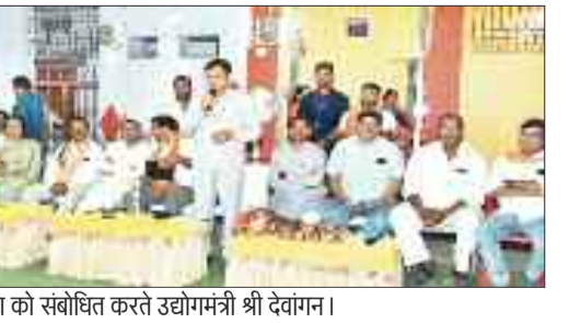
नुकड़ सभा को संबोधित करते उद्योगमंत्री श्री देवांगन।

जनप्रतिनिधि गंभीर रहे न कोई पहल की। यही वजह है की आज शहर की रिहायशी इलाकों की सूरत बस्तियों से भी बदतर हो चुकी है। उक्त बातें रविवार को एमपी नगर में आयोजित नुकड़ सभा को संबोधित करते हुए उद्योग मंत्री लखनलाल देवांगन ने कही। उन्होंने कहा कि आज शहर के जिन कॉलोनियों को निगम ने बसाया था उनमें एक की भी स्थिति